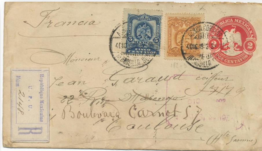
Fig. 401.- S46 certificado a Toulouse (Francia) completando su franqueo con sellos adhesivos de la serie "águilas" de 1899.