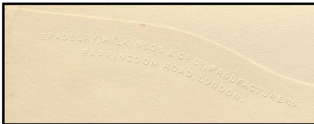
Fig. 397.- Nombre del impresor en el reverso de los sobres de la segunda emisión de 1899.