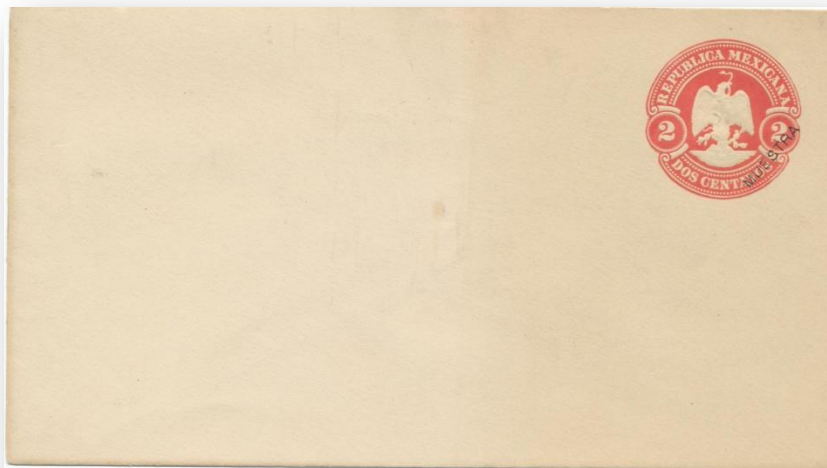
Fig. 398.- S46 con la palabra "MUESTRA".

De los tres sobres de esta emisión se conocen ejemplares con la palabra "MUESTRA" sobreimpresa diagonalmente en la esquina inferior del sello en color negro y con letras de 15 x 2 mm (véanse las Figs. 398, 399 y 400).