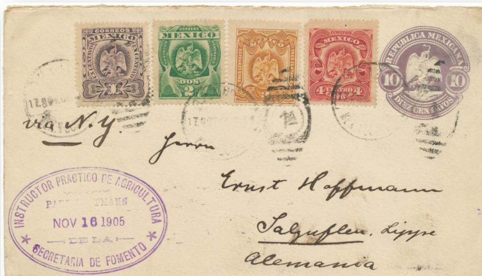
Fig. 402.- S48 circulado a Alemania completando su franqueo con sellos adhesivos de la serie "águilas" de 1899.