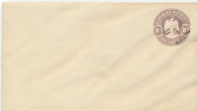
Fig. 400.- S48 con la palabra "MUESTRA".